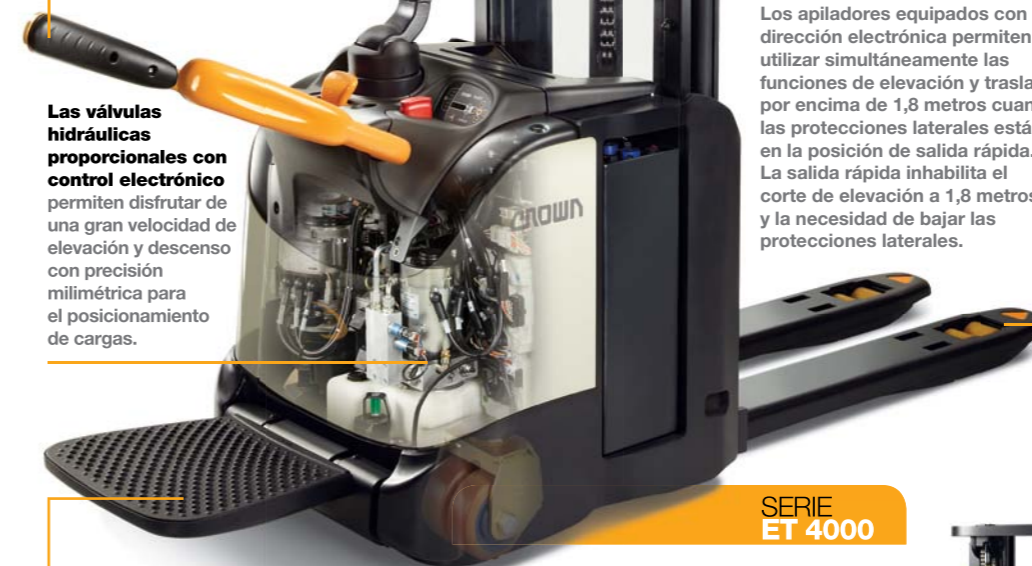
SERIE ET 4000

Las protecciones laterales con función de salida rápida se alcanzan fácilmente para que el operario pueda salir sin dificultad por el lateral de la máquina en lugares congestionados. Los apiladores con dirección mecánica automáticamente cortan la elevación a 1,8 metros, salvo que las protecciones laterales estén bajadas del todo.