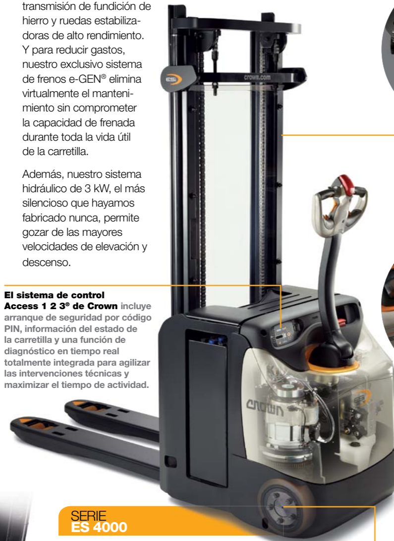
SERIE ES 4000

El sistema de control Access 1 2 3® de Crown incluye arranque de seguridad por código PIN, información del estado de la carretilla y una función de diagnóstico en tiempo real totalmente integrada para agilizar las intervenciones técnicas y maximizar el tiempo de actividad.